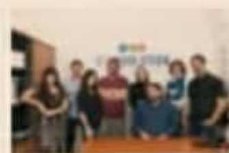
Il Team di IM Evolution

Grazie ad un team di professionisti che agevolano le proficue connessioni con le varie istanze sociali, economiche e culturali